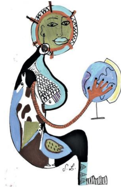
A wholesome world , Solenne Lestienne, 2022

Le Livre Blanc est disponible ici : https://www.ilaparis2023.org/livres-blancs/la-sante/